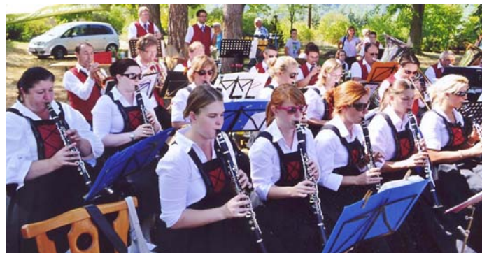
Frühschoppen mit der Musikkapelle Paudorf.