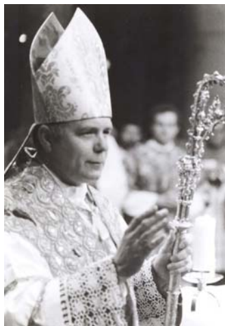
Bischof Maximilian nach seiner Weihe (1982).

1993 promovierte ihn die Katholisch-Theologische Fa-