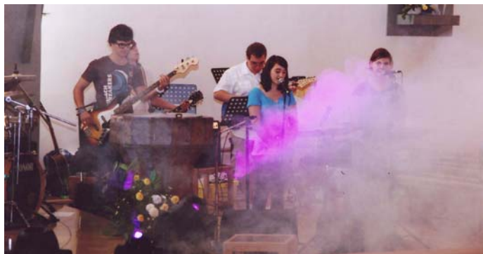
Jugendmesse mit „Saturday Evening Rock“.