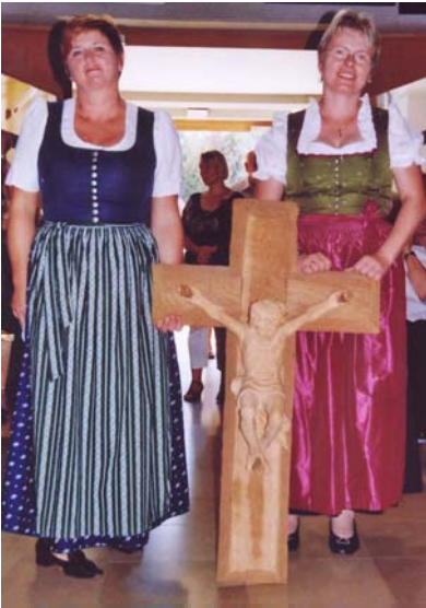
Jubiläumsgabe: Ein vom Höhenbacher Künstler Hannes Hermann Bischof gestiftetes Kreuz.

In diesen 30 Jahren durfte ich 940 Kinder taufen, 540 Menschen musste ich zu Grabe geleiten, etwa 300 sind aus der Kirche ausgetreten, 50 konnte ich wieder in die Kirche aufnehmen.