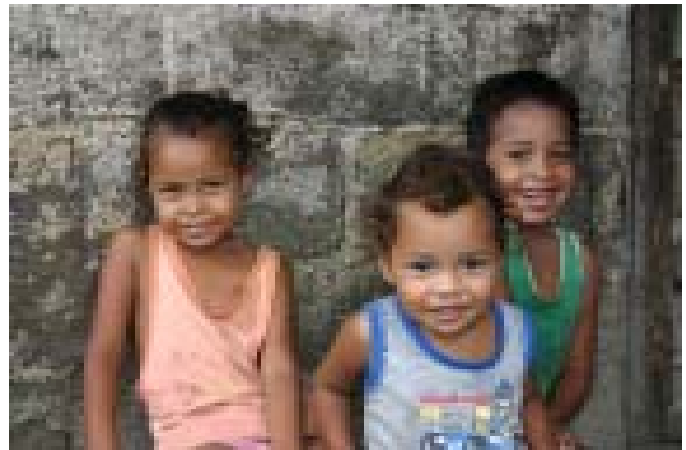
Kinder leiden am stärksten. Stift Klosterneuburg hilft.

In Tegucigalpa leben insgesamt rund 10.000 Kinder auf der Straße. In keinem anderen Land Lateinamerikas ist dabei die Gewalt gegen Straßenkinder so groß wie in Honduras. Morde stehen auf der Tagesordnung. Allein von 1998 bis 2008 hat „Casa Alianza“ 4.608 Morde an Straßenkindern dokumentiert. Die Opfer waren alle jünger als 17, sie wurden von Killer-