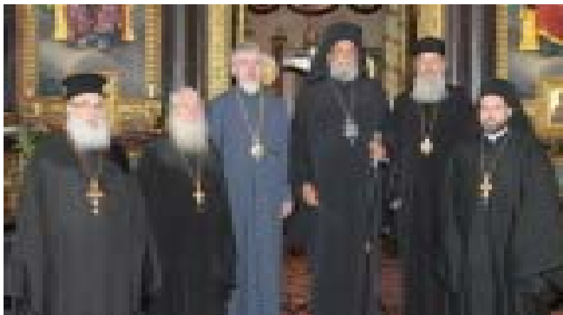
Die Mitglieder der „Orthodoxen Bischofskonferenz in Österreich“.