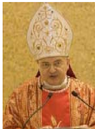
Erzbischof Mauro Piacenza.

Der aus dem Franziskaner-Orden stammende Hummes war bis 2006 Erzbischof von Sao Paulo. Als Präfekt der obersten Klerus-Behörde war er federführend für die Vorbereitung und Durchführung des Internationalen Priesterjahres 2009/10 zuständig. Ebenfalls am 7. Oktober nahm der Papst das Rücktrittsgesuch des deutschen Kurienkardinals Paul Josef Cordes (76) an. Der Präsident des Päpstlichen Caritas-Ministeriums „Cor unum“ habe dem Papst seinen Amtsverzicht aus Alter-