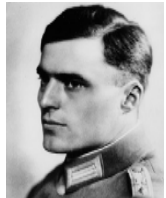
Claus Schenk Graf von Stauffenberg.

Am 20. Juli 1944 versuchte eine Gruppe deutscher Offiziere unter der Führung von Oberst Claus Schenk Graf von Stauffenberg, Hitler durch einen Staatsstreich zu beseitigen. Geplant war ein Sprengstoffanschlag während einer Bespre-