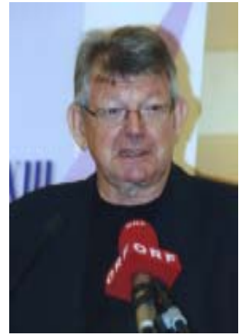
Bischof Erwin Kräutler.

An der Spitze des Widerstandes am Mega-Staudammprojekt steht seit Jahren der aus Österreich stammende