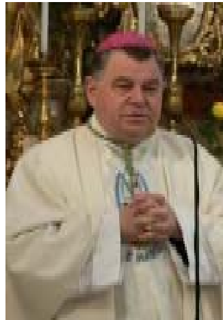
Erzbischof Dominik Duka.

des Grundgehalts das bewegliche Element des Gehalts (Rangwürdigung und Entgelt für erhöhte Leistung) auf ein Minimum gedrückt worden“ sei.