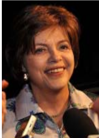
Präsidentschaftskandidatin Dilma Rousseff.

Die in den Umfragen deutlich führende Kandidatin der regierenden Arbeiterpartei PT (Partido dos Trabalhadores) erklärte nun in einem offenen „Brief an das Volk Gottes“, dass sie für Familienwerte stehe und deshalb nicht von sich aus eine Legalisierung der „Homo-Ehe“ und eine Liberalisierung der Abtreibung vorantreiben werde. Damit gibt die 62-Jährige Forderungen sowohl der katholischen Kirche sowie der evangelikalen Pfingstkirchen nach, die von ihr eine klare Aussage hierzu gefordert hatten, berichtete die deutsche katholische Nachrichtenagentur KNA. Rousseff, Tochter eines bulgarischen Einwanderers, hatte sich in den späten 1960er Jahren trotz zisterischen Oppositionsbewegungen angeschlossen. Von den damals regierenden Militärs wurde sie inhaftiert und gefoltert. Nach der Rückkehr zur Demokratie machte sie Karriere in der Politik, wobei sie stets liberale Positionen vertrat. Das hatte der Kandidatin zuletzt harsche Kritik der katholischen Kirche und der Pfingstkirchen