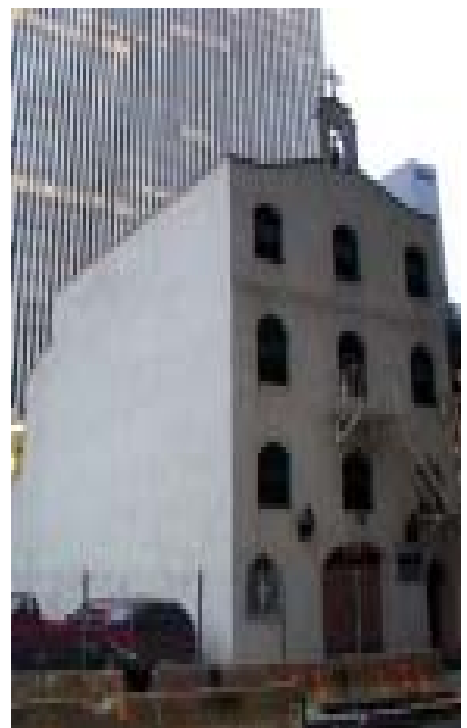
Die griechisch-orthodoxe Kirche St. Nicolas vor ihrer Zerstörung durch Islamisten im Jahr 2001.

Der Wiederaufbau der orthodoxen Kirche wird nicht vom Ausland subventioniert. Er soll aus Mitteln der Gemeinde und mit Unterstützung der Stadt New York von statten gehen.