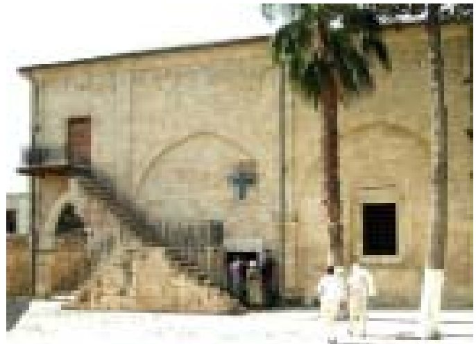
Paulus-Kirche in Tarsus.

Noch bis ins 20. Jahrhundert stellten die Christen in der heutigen Türkei etwa 30 Prozent der Bevölkerung. Bis heute sank ihre Zahl auf nur noch etwa 100.000 bis 150.000. Bei rund 72 Millionen Bürgern insgesamt, die zu über 99 Prozent Muslime sind, ist das ein Anteil von circa 0,2 Prozent. Ursachen für den Rückgang sind unter anderen der Genozid an den Armeniern während