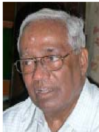
Erzbischof Raphael Cheenath.

Durch die Errichtung des Staudamms würden etwa 500 Quadratkilometer Urwald überschwemmt, darunter Teile eines Indio-Reservates. Deshalb kämpfen Ureinwohner und Umweltschutzgruppen bereits seit den 1970er Jahren gegen das Projekt. Mindestens 17.000 Menschen müssen dafür umgesiedelt werden. Zudem bezweifeln die Kritiker den wirtschaftlichen Nutzen der Anlage. Laut Plänen der Regierung soll das angeschlossene Kraftwerk ab 2015 bis zu 11.200 Megawatt Strom liefern. Damit wäre es Brasiliens zweitgrößtes Wasserkraftwerk und das drittgrößte weltweit.