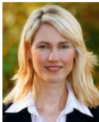
Rechts: Manuela Schwesig.

Manuela Schwesig ist seit 2008 Sozialministerin von Mecklenburg-Vorpommern und seit 2009 stellvertretende SPD-Bundvorsitzende.