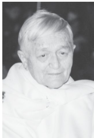
Frere Roger Schütz, Gründer der Taize-Gemeinschaft.

Vor 70 Jahren gründete Frere Roger im burgundischen Taize eine ökumenische Gemein-