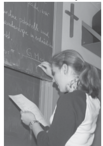
Kreuze sollten nicht aus Schulen verschwinden.