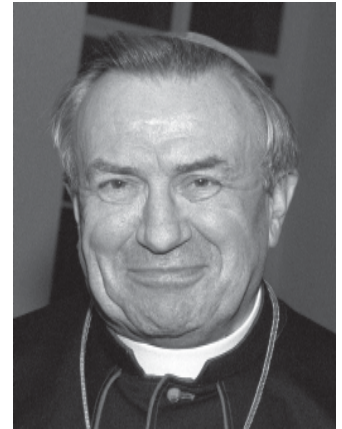
Kardinal Karl Lehmann.

Lehmann bekräftigte gegenüber den „Salzburger Nachrichten“ auch seine skeptische Haltung gegenüber einer rechtlichen Gleichstellung des Islam mit den christlichen Kirchen in Deutschland: „Selbstverständlich soll der Islam eine Anerkennung als legitime Religion in der Gesellschaft haben bzw. erhalten. Aber eine