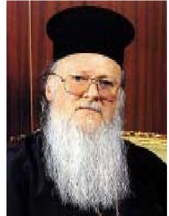
Patriarch Bartholomaios I.

Der Ökumenische Patriarch von Konstantinopel, Bartholomaios I., wird Ehrendoktor der Katholischen Johannes-Paul-II.-Universität Lublin.