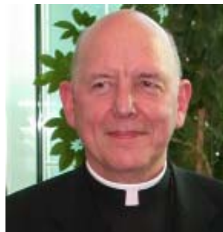
Bischof Klaus Küng.

Für einen „Neuanfang“ und „größere Authentizität in der Seelsorge und im kirchlichen Leben“ hat sich Bischof Klaus Küng angesichts der gegenwärtigen kirchlichen Situation ausgesprochen.