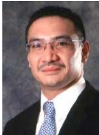
Innenminister Hishammuddin Hussein.

In Folge des Richterspruchs war es im heurigen Jänner im mehrheitlich muslimischen Malaysia zu Brandanschlägen auf christliche