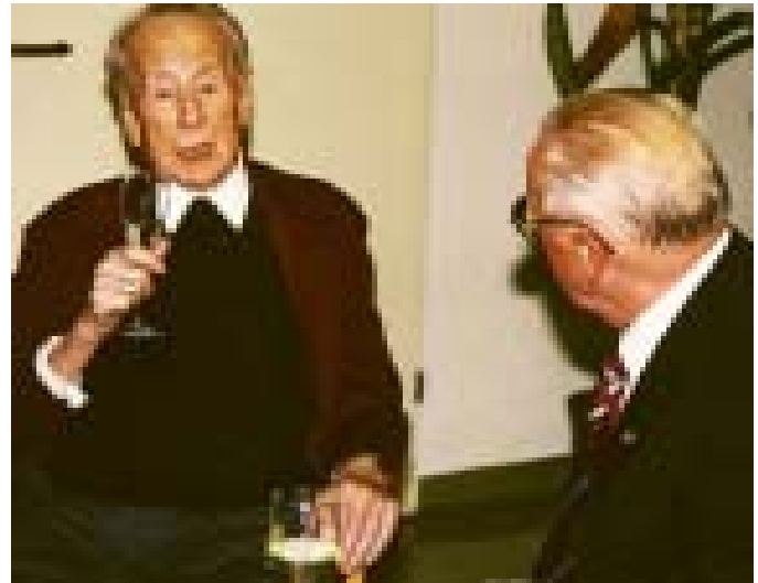
Zwei Monate vor seinem Tod: Kardinal Franz König im Gespräch mit einem niederösterreichischen Pfarrgemeinderat.

und auch keiner der Gewerkschaftler, kein Bischof der Bauern und auch nicht einer der Städter, ich der Bischof aller Katholiken“. Mit dieser Formulierung habe König die Bedeutung des „christlichen Universalismus in einer geteilten Welt“ herausgearbeitet.