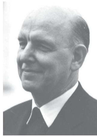
Familien-Bischof Klaus Küng.

ganzheitlichen Hilfe erkannt, die nicht nur den medizinischen Aspekt berücksichtigt, sondern auch die materiellen, menschlichen und seelsorglichen Bedürfnisse der Betroffenen beachtet. Um die rasche Ausbreitung dieser ohne Therapie tödlich verlaufenden Krankheit zu stoppen, habe die Kirche stets auf eine breite Strategie gesetzt: auf Information über die Krankheit, auf die Ermutigung, den Arzt aufzusuchen, vor allem aber auf eine „sorgfältige Partnerwahl und Treue in der Ehe sowie damit verbunden die Ent-