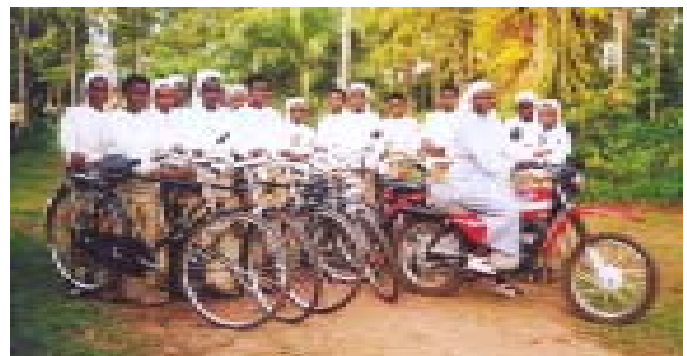
Fahrräder für Ordensfrauen, die in den Dörfern als Religionslehrerinnen tätig sind.

Am 25. Juli, dem „Christophorus-Sonntag“, bittet die MIVA wieder „um einen ZentelCent pro unfallfrei gefahrenen Kilometer“. Heuer sollen soziale und pastorale Projekte in der Demokratischen Republik Kongo mit angepassten Transportmitteln unterstützt werden. 2009 wurde 4,5 Millionen Euro gespendet. Damit konnten 949 Fahrräder, 235 Autos, 73 Motorräder, 10 Eselskarren, 4 Mopeds, 4 Traktoren, 3 Boote und 2 Außenbordmotore angeschafft werden.