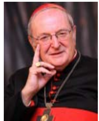
Kardinal Joachim Meisner.

Der Kardinal verteidigte vor diesem Hintergrund erneut die Pflicht der Priester zur Ehelosigkeit. „Überzeugend gelebt, ist der Zölibat immer noch der schlagendste Gottesbeweis.“ Der Zölibat sei ein Stachel für