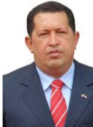
Staatspräsident Hugo Chavez.

Auf einer Veranstaltung seiner Partei PSUV kritisierte Chavez zudem die Hierarchie und das Papstamt. „Mit allem Respekt vor dem Vatikan und dessen Staatsoberhaupt, dem Papst: Er ist kein Botschafter Christi auf Erden, wie sie sagen“, zitiert das Blatt „El Nuevo Herald“ den Präsidenten, der sich als Anhänger der Be-